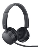
Auriculares inalámbricos Dell Pro : WL5022

Realice múltiples tareas sin inconvenientes en 3 dispositivos con esta combinación de teclado de tamaño completo y mouse esculpido premium con accesos directos programables y una duración de la batería de 36 meses.