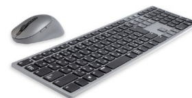
Teclado y mouse inalámbricos para múltiples dispositivos Dell Premier - KM7321W

Aumente su productividad con este innovador monitor QHD de 27 pulgadas con concentrador y una amplia cobertura de color que incluye DCI-P3. Cuenta con la característica ComfortView Plus, un filtro incorporado de baja emisión de luz azul que está siempre activo, USB-C con suministro de alimentación de hasta 90 W y conectividad RJ45.