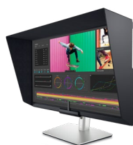
Dell UltraSharp 32 HDR Monitor PremierColor - UP3221Q

Cree contenido 4K HDR impresionante en el primer monitor profesional del mundo con zonas de atenuación con retroiluminación directa mini-LED 2K.*