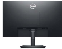
Vista trasera: ranura de manejo de cables

Ajuste el panel a su posición de visualización más cómoda con facilidad.